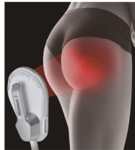
骨盤底筋の強化・ヒップアップ