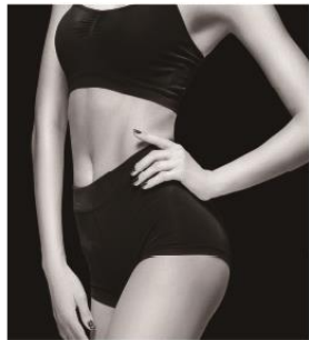
バランスの取れたボディ