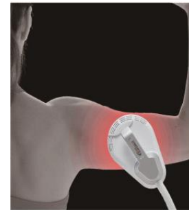
引き締まった二の腕