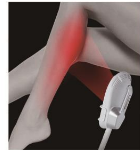
引き締まったふくらはぎ